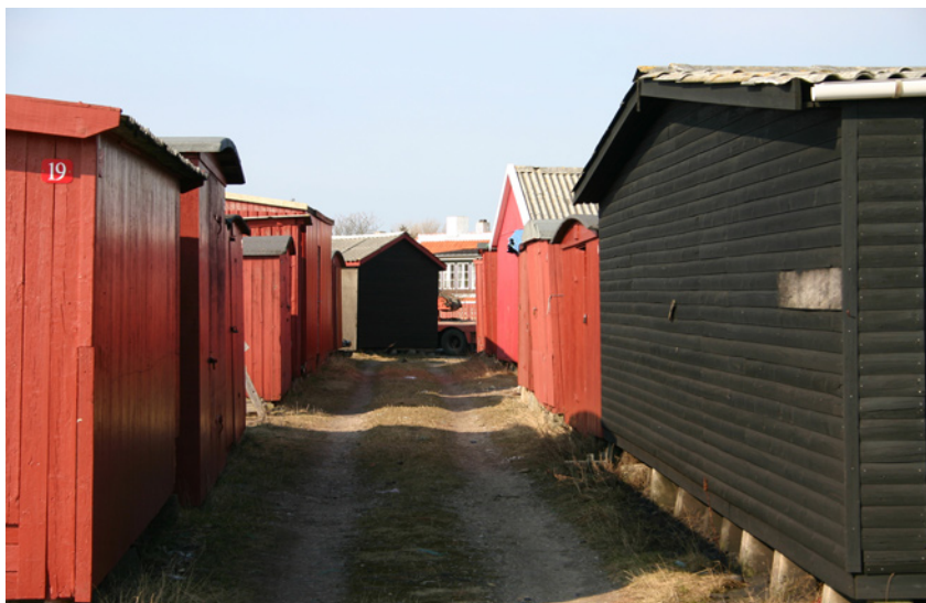
Skurbyen på havnen. KMH, 2006.

Havnepladsen var oprindeligt en åben og græsklædt plads, hvis funktion var oplagring af materiel og stejleplads. Efterhånden byggedes toldbygning, sømandshjem, pakhuse og havneadministration. I dag er pladsens kontur næsten udvisket og virker nærmest som en færdselsåre, hvor trafikken dominerer.